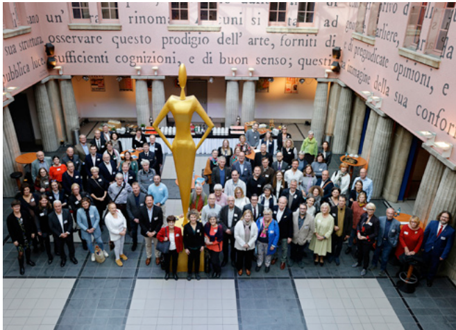
Frisch gegründet: das Stiftungsnetzwerk Bildung in Hessen