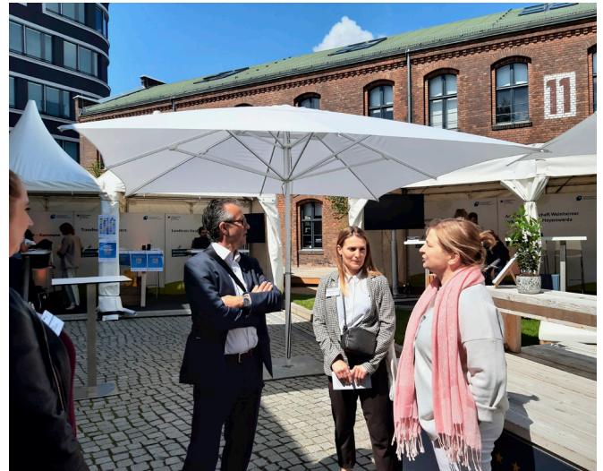
Im Gespräch bei der Bundeskonferenz Kommunales Bildungsmanagement in Berlin

Nähere Informationen dazu finden Sie auf unserer Website unter „Veranstaltungen“ und „Material“