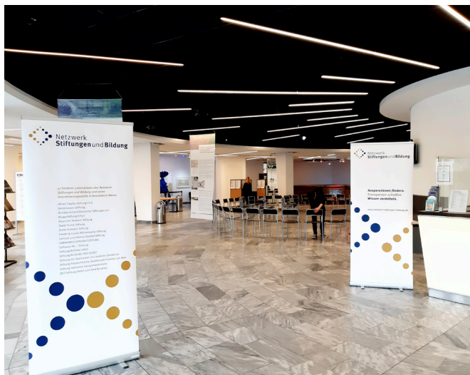
Das Netzwerk tagte im Zeiss-Großplanetarium in Berlin