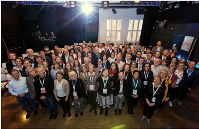
Rund 100 Netties und Freunde des Netzwerkes Stiftungen und Bildung kamen am 27. September 2019 auf dem Berliner Pfefferberg zusammen.

Bereits zum vierten Mal versammelten sich die Teilhaberinnen und Teilhaber des Netzwerkes Stiftungen und Bildung Ende September in Berlin, um beim Jahrestreffen und dem informellen Treffen am Vorabend Gedanken und Visionen sowie Fragen und Antworten zu teilen, sich (besser) kennenzulernen und sich intensiv auszutauschen.