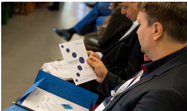
Das Jahrestreffen stand wieder ganz im Zeichen des intensiven Austauschs.

Am 28. September 2018 fand das dritte Jahrestreffen für alle Netties und Freunde des Netzwerkes Stiftungen und Bildung statt. Das Treffen ist der Höhepunkt des Netzwerkjahres. Rund 70 Netzwerkteilhaber kamen auf dem Berliner Pfefferberg zusammen, um sich kennenzulernen, sich fachlich auszutauschen, Kontakte zu knüpfen und zu vertiefen. Das Jahrestreffen 2018 fand wieder in Form eines BarCamps statt. Die Themen, die die Netties am stärksten bewegen, sind Demokratieförderung und Digitalisierung. Auf unserer Website finden Sie unter „Jahrestreffen2018“ eine Dokumentation mit Bildern zur Veranstaltung.