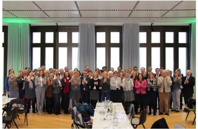
Rund 60 Teilnehmende besiegelten feierlich die Gründung des Stiftungsnetzwerkes Bildung in Bayern.

Bei Interesse an einer Beteiligung an einem bestehenden oder an einem sich im Aufbau oder in Planung befindenden Stiftungsnetzwerk Bildung kontaktieren Sie uns gerne. Weitere Informationen zu den Stiftungsnetzwerken auf Länderebene finden Sie unter www.netzwerk-stiftungen-bildung.de/netzwerk/stiftungsnetzwerke-bildung-auf-laenderebene .